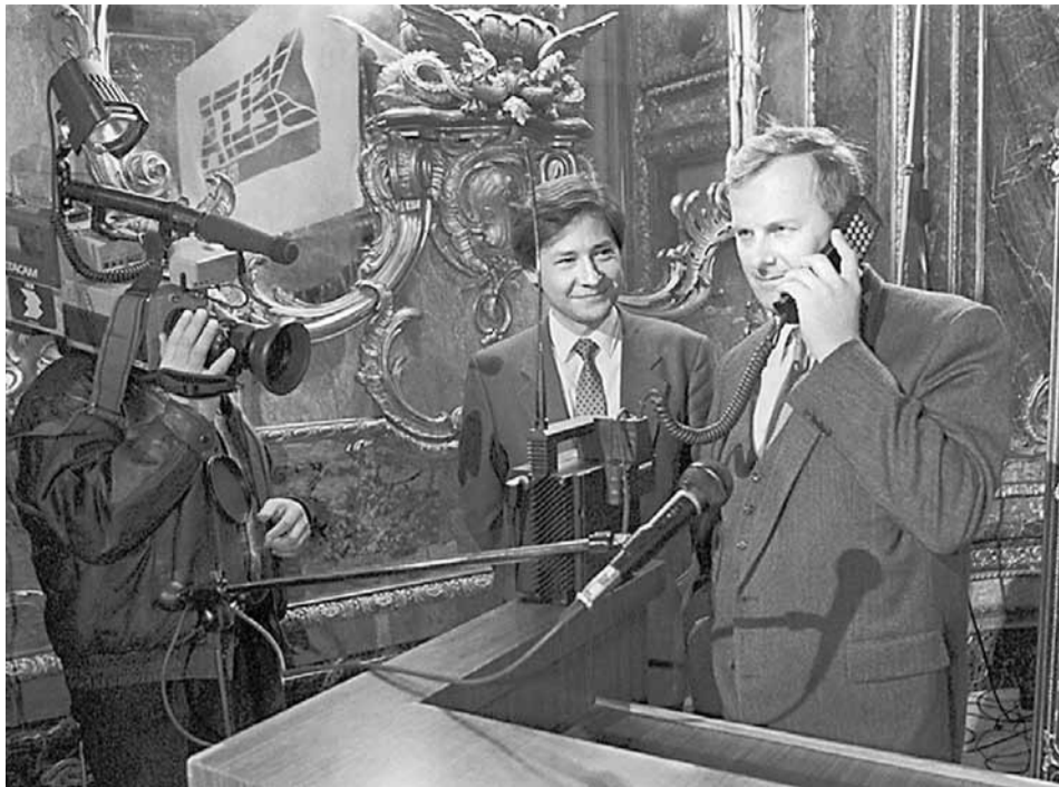
Первым россиянином, сделавшим звонок по сотовому телефону, был Анатолий Собчак

– Мой первый Siemens привез из Москвы давний друг 17 лет назад. Вначале я пользовался им в исключительно редких случаях, но постепенно понял, что сотовый удобен, бережет время, и перешел в разряд «злостных» пользователей, тех самых, которые лишний раз и не дойдут