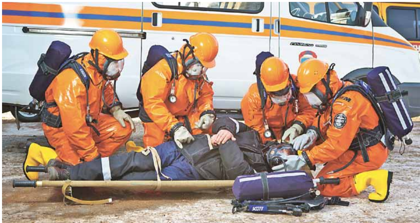
Учения – неотъемлемая часть работы газоспасателей