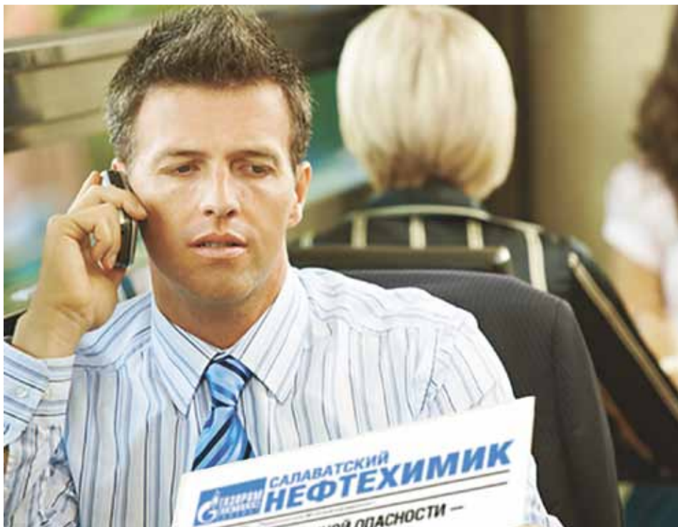
За 20 лет мобильные телефоны прочно вошли в нашу жизнь

И вот как-то в очередной раз случился со мной этот казус. Дело было летом, в выходной день. Вдруг по сотовому телефону сообщают, что нужно срочно приехать на работу. Сел за руль машины, выехал на место, быстро освободился и радостную весть о том, что намеченные планы остаются в силе, решил сообщить жене. Рука привычно потянулась к мобильному... а его на месте не оказалось. Начались поиски: приехал домой – телефона нет, вернулся на работу – телефона нет, заехал в автомойку, где мыл утром машину, – телефона никто не видел. Стою около автомойки растерянный и вдруг слышу: из травы доносится писк разряжающегося аккумулятора. Вот он где был, голубчик! И хотя планы из-за затраченного на поиски времени пришлось поменять, настроение ничуть не испортилось: телефон на этот раз был найден!